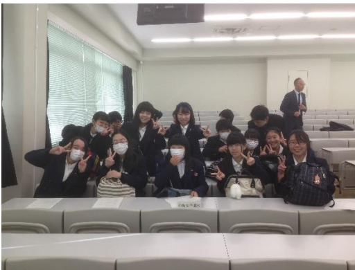
チームプレー！仲よしメンバー