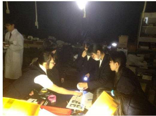
地球と太陽の位置関係は？