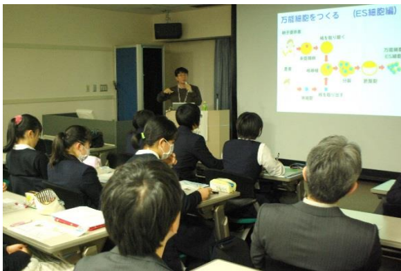
発生と再生医療に関する講義

最後に第三部として、女性研究者2名による、「研究者への道のりと研究の楽しさ」というテーマで、お話しをいただき、その内容について意見交換を行いました。