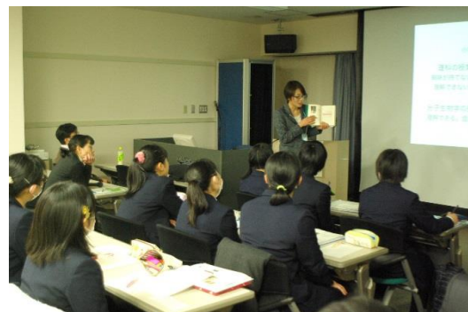
研究者への道のりに関するお話