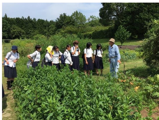
薬用植物園の見学