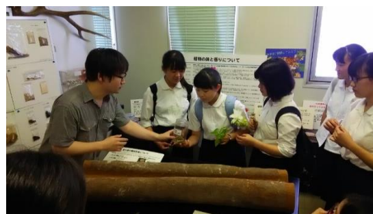
漢方薬に関する説明