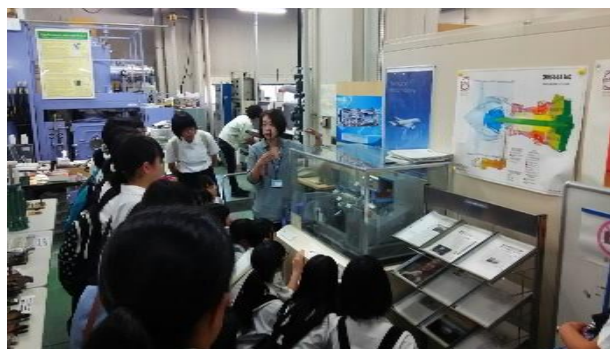
研究に関する説明