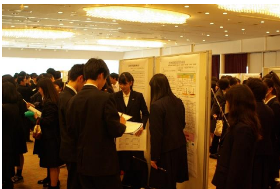
ポスター発表 (SS 探究 2 年)

本発表会は今年度で終了となり、次年度からは 9 月に中間的な発表会が行われる予定です。