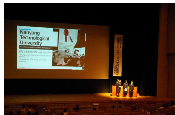
口頭発表 (海外研修)