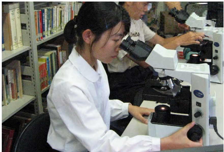
酵母の変異体探し