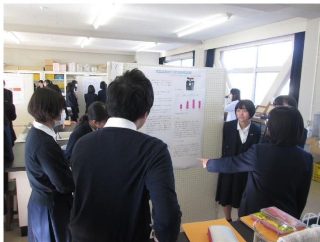
生徒どうしの積極的な意見交換