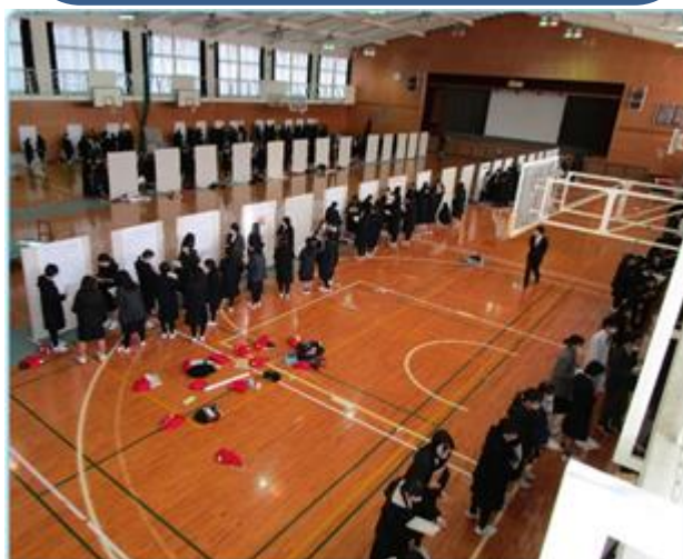
熱心にポスター発表を聞く生徒たち 興味深い研究がたくさんありました