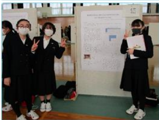
発表にも慣れて、余裕のピース