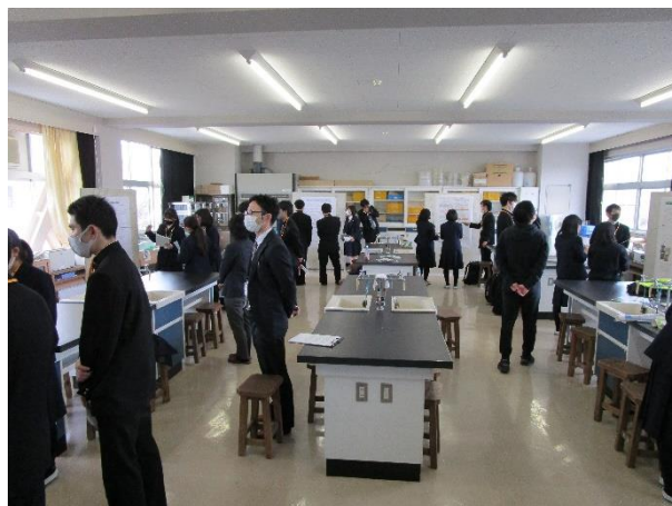
会場の様子（化学室）