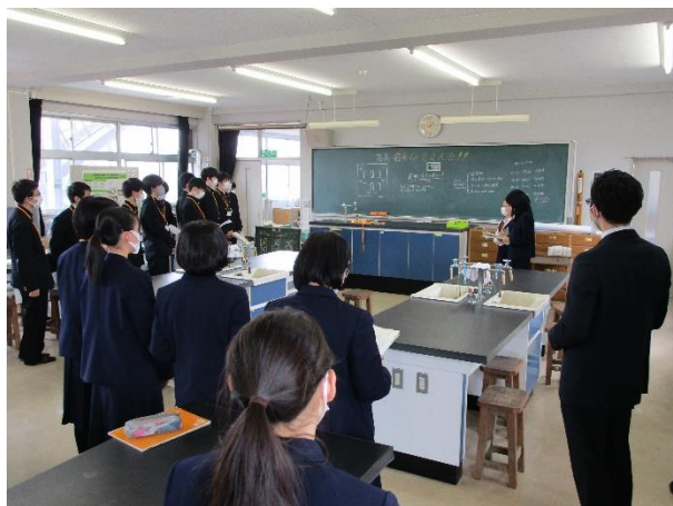
始まりの様子 当日の司会等も生徒が行いました。

今年度は発表会の多くが中止となってしまう、生徒は外部に発表を行う機会や、他校の生徒の研究発表を見る機会がありませんでした。そこで、企画した行事でしたが、生徒にとっても非常に刺激となった発表会になったかと思います。コロナ禍により来年度の行事も不透明なところが多いですが、このような機会を多く作り、生徒にとって学びがいのあるものにしてきたいと考えています。